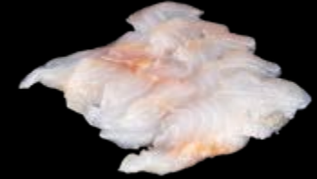
Sashimi Dorade 5 St. 13,90 € Serviert mit Nori- und japanischen Shiso-Blättern