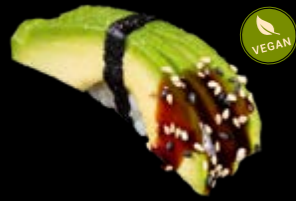
N1 Avocado 6,00 €