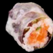
SR9 Lachs scharf 13,00 € Lachstatar mit Spicy-Mayo und Gurken