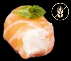
M13 Lachsrolle 9,00 €