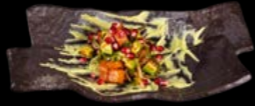
Salmon Tatar 17,00 € Lachs und Avocado-Würfel in Olivenöl garniert mit Gurken, frischen Granat apfelkernen und Avocado-Trüffelcreme