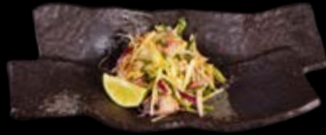
Tatar Variation mariniert 18,00 € Feine Stücke von Hamachi und Dorade in Olivenöl, feine Apfelstreifen, rote Zwiebeln und Gurken mit frischem Koriander und Minze