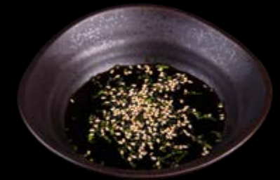
Hausgemachte Soße 5,00 €