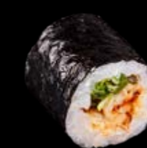
M16 Gegrillter Aal 10,00 €