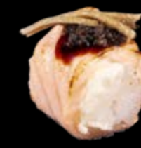
M19 Salmon Trüffel 12,00 €