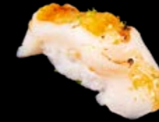
N14 Flambierte Jakobsmuschel 9,00 € (Miso Yuzu Soße)