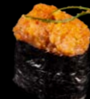
N19 Gunkan Thunfisch scharf 9,00 € Thunfischstatar, Avocado, Chilli Soße, Sesamöl und Frühlingszwiebeln