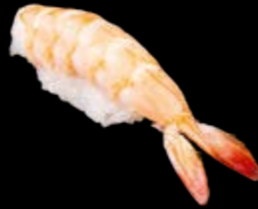
N2 Garnelen 6,80 €