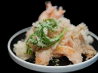
Tempura Moriawase 24,80 €