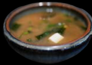
Miso Suppe 5,50 € Mit Clam (Vongole) 13,90 € Mit Riesengarnelen 13,90 € Extras: Scharf 0,50 €