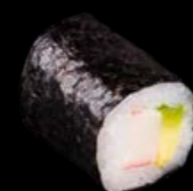
M6 Surimi Avocado 7,00 €