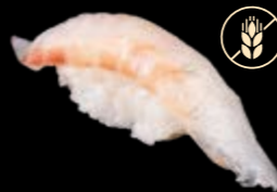
N7 Dorade 6,80 €