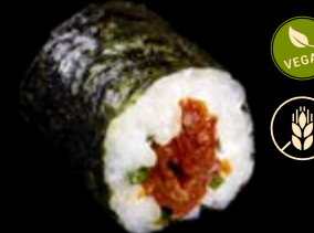
M20 Getrocknete Tomaten Maki 6,00 €