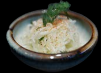
Krautsalat 5,00 €