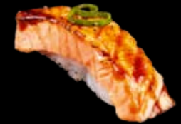
N15 Pfeffersalmon 8,00 € Flambierter Lachs mit Teriyaki Soße, Frühlingszwiebeln und Pfeffer