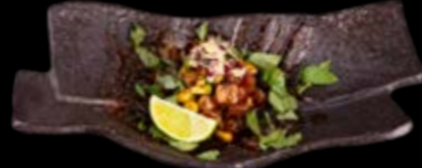
Tuna Tatar 18,50 € MUST TRY Feine Thunfischstücke und Avocado mit roten Zwiebeln, geriebenem Ingwer, Thai Basilikum und scharfer hausgemachter Soße