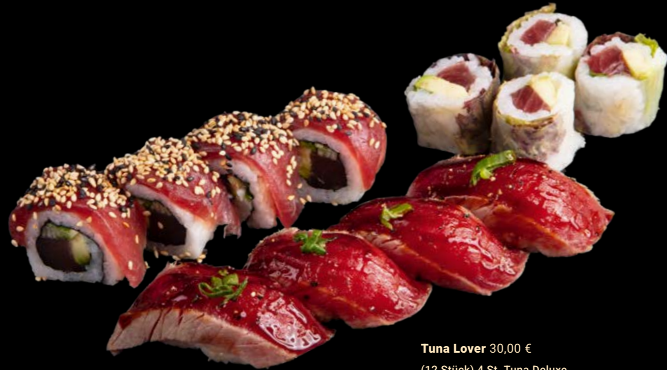
Tuna Lover 30,00 €

(12 Stück) 4 St. Tuna Deluxe, 4 St. Springroll Tuna Avocado, 4 St. Pfeffer tuna Nigiris