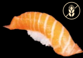
N4 Lachs 6,80 €