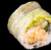
SR8 Negi Ebi 11,00 € Gehackte Garnelen und Surimi, Spicy-Mayo, Frühlingszwiebeln und Koriander