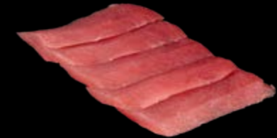
Sashimi Thunfisch 5 St. 19,90 € Serviert mit Nori- und japanischen Shiso-Blättern