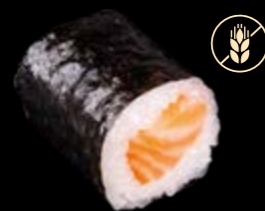
M7 Lachs 7,00 €