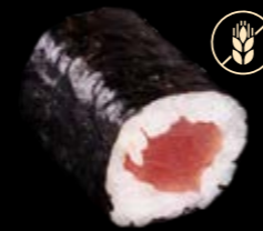
M10 Thunfisch 8,00 €