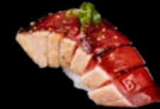
N16 Pfeffertuna 9,00 € Flambierter Thunfisch mit Teriyakisoße, Frühlingszwiebeln, Sesamöl und Pfeffer