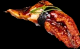
N8 Aal 9,00 €