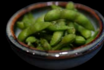
Edamame 6,00 €