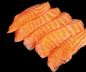
Sashimi Lachs 5 St. 13,90 € Serviert mit Nori- und japanischen Shiso-Blättern