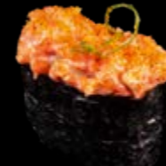
N18 Gunkan Lachs scharf 8,00 € Lachstatar, Avocado, Spicy-Mayo, Fisch- rogen und Frühlingszwiebeln