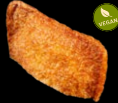
N3 Tofu 6,00 €