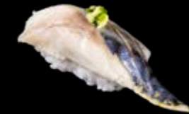
N17 Makrele 6,80 € Eingelegte Makrele mit geriebenem Ingwer und Schnittlauch