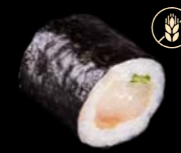
M15 Hamachi 8,00 €