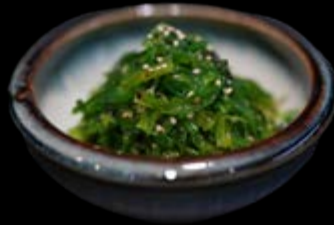
Algensalat 6,00 €