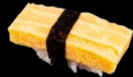
N5 Omelette 6,00 €