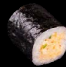
M11 Gekochte Garnelen 6,50 €