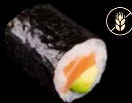
M8 Lachs Avocado 8,00 €