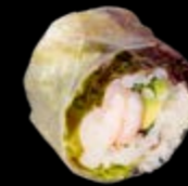
SR7 Groß-Garnelen Avocado 13,00 € Mit Minze und Koriander