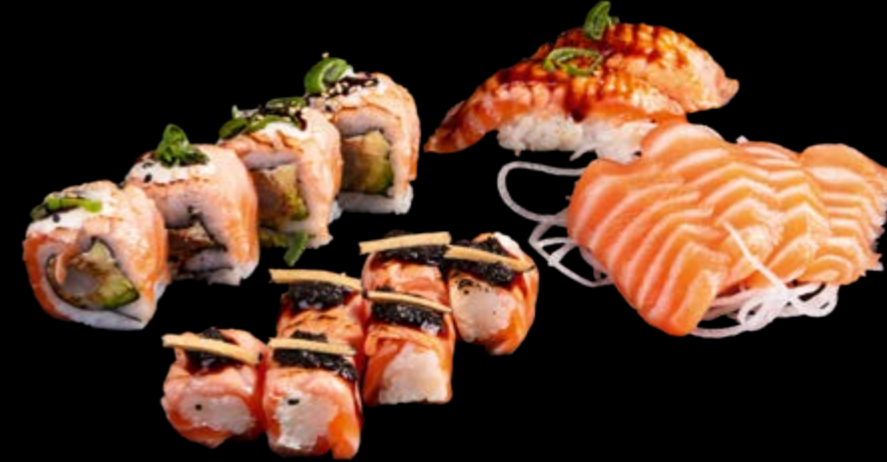
Salmon on Fire 30,00 €

(12 Stück) 4 St. Tuna Deluxe, 4 St. Springroll Tuna Avocado, 4 St. Pfeffer tuna Nigiris