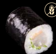
M14 Dorade 6,50 €