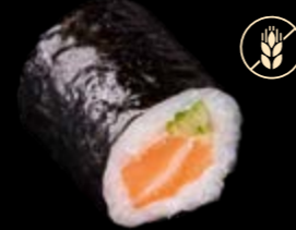
M9 Lachs Gurke 7,00 €