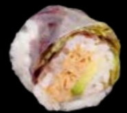
SR4 Gekochter Thunfisch Avocado 10,00 € Mit Frühlingszwiebeln