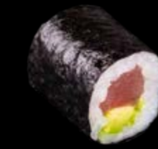
M18 Thunfisch Avocado 9,50 €