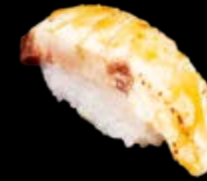
N13 Flambierte Hamachi 9,00 € (Miso Yuzu Soße)