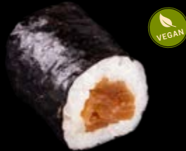
M4 Eingelegter Kürbis 5,00 €