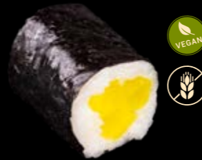
M3 Eingelegter Rettich 5,00 €