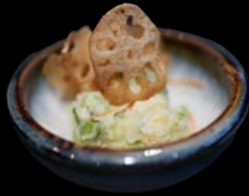
Kartoffel-Edamame-Salat 8,00 €