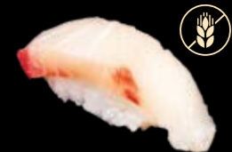
N9 Hamachi 9,00 €