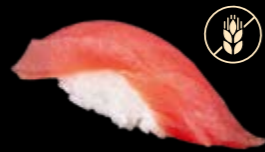
N6 Thunfisch 9,00 €