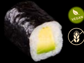
M2 Avocado 5,00 €