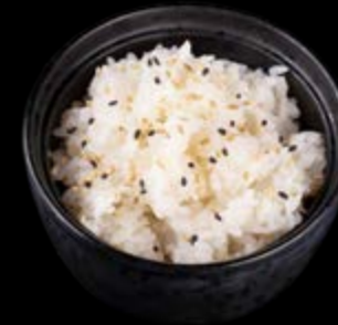
Sushi-Reis 4,00 €