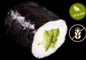
M1 Gurken 4,00 €