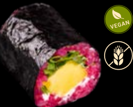
M17 Mango Rucola 6,50 €