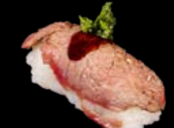
N20 Beef Fuoco 9,00 € Flambiertes Flanksteak garniert mit Teriyakisoße, italienischer Kräutersoße und Pfeffer