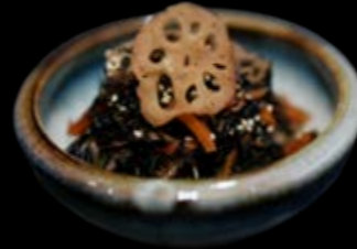
Hijiki-Salat 6,00 €