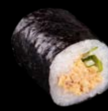
M12 Gekochter Thunfisch 6,50 €