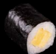
M5 Süßes Omelette 5,00 €