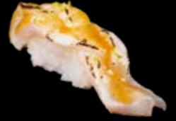
N10 Flambierte Dorade 8,00 € (Miso Yuzu Soße)