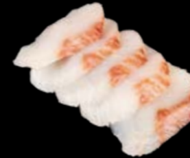
Sashimi Hamachi 17,90 € Serviert mit Nori- und japanischen Shiso-Blättern