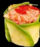
N12 Tulip Lachstatar 9,00 € Lachstatar umwickelt in dünnen Avocadoscheiben